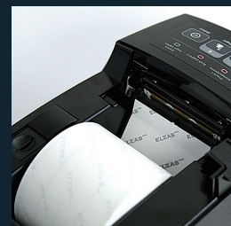
Mechanizm drukujący easy load